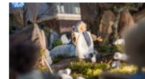
Die neue Krippe in Einhausen