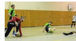
Hobbykicker im Kampf um den Ball