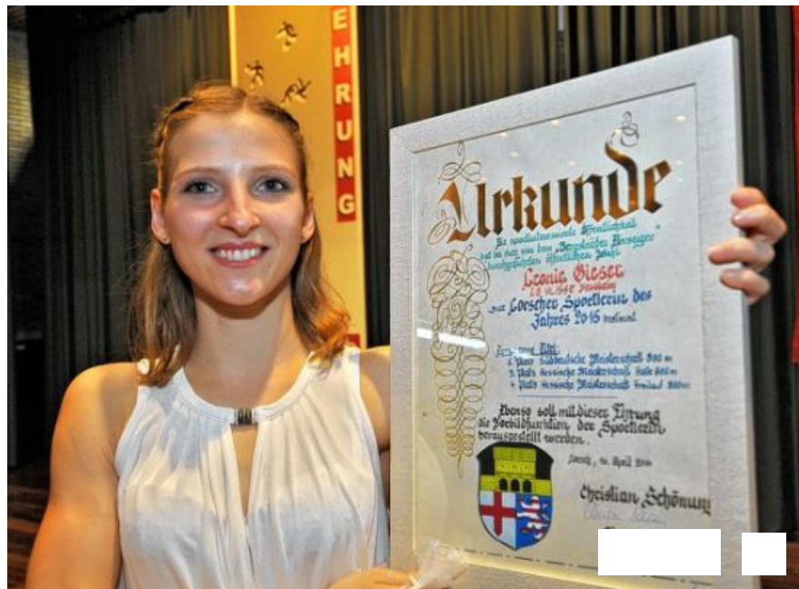
Alle Bilder anzeigen

Von unserem Redaktionsmitglied Nina Schmelzing