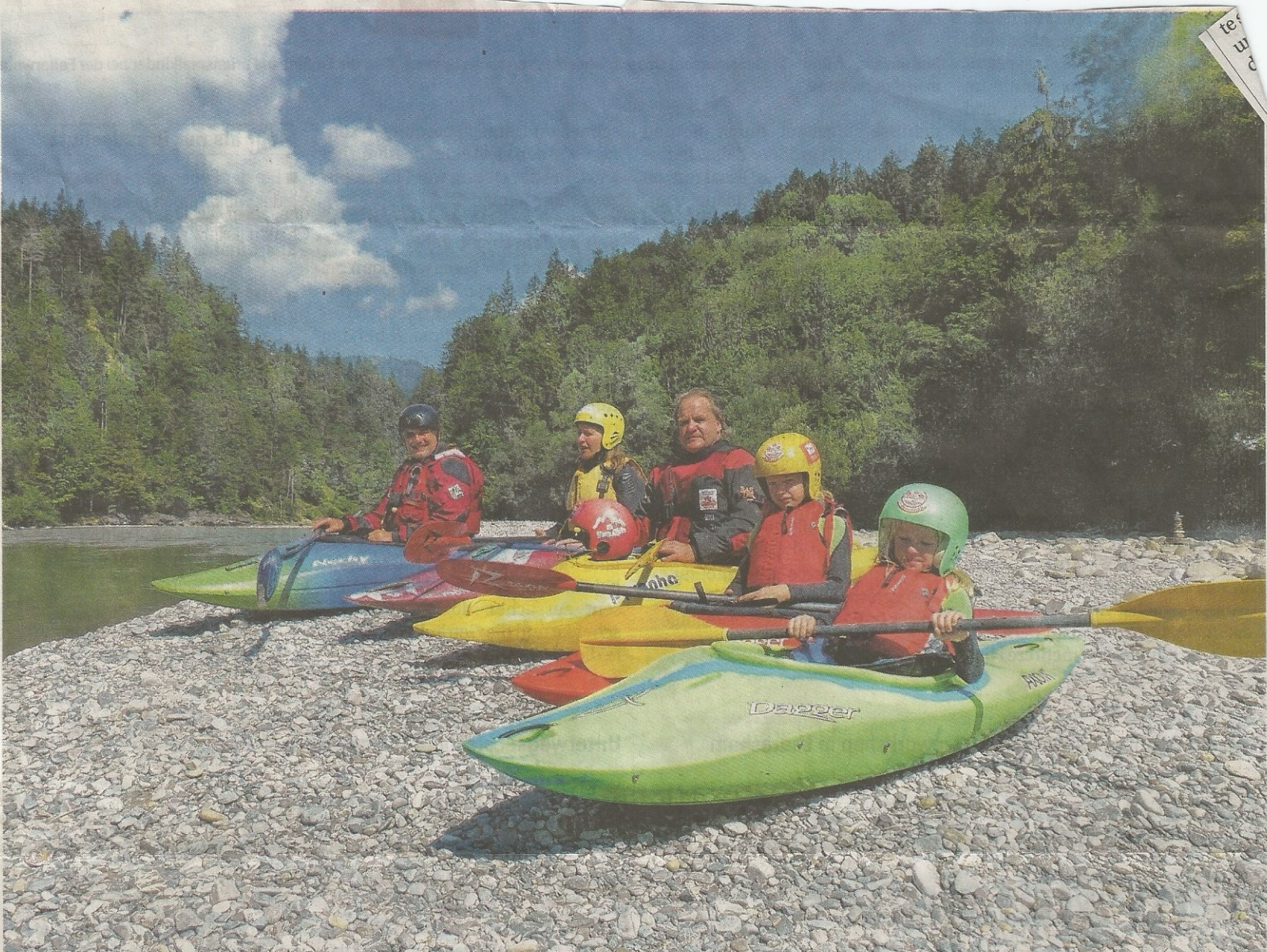
Die neuen Kinderkanus der Lorsch Naturfreunde haben sich im Praxistest schon bewährt. Jetzt sollen sie im Training eingesetzt werden.